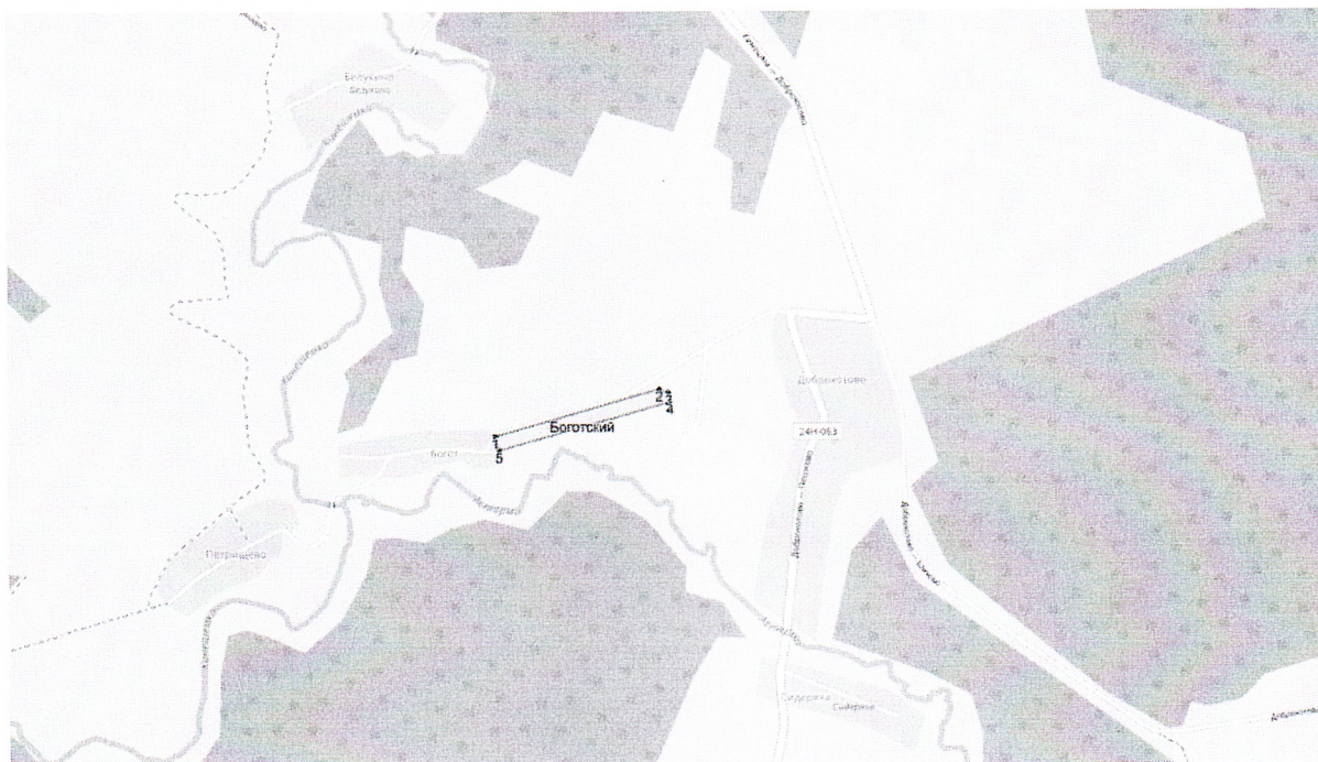
СХЕМА РАСПОЛОЖЕНИЯ УЧАСТКА НЕДР И ОПИСАНИЕ ЕГО ПРОСТРАНСТВЕННЫХ ГРАНИЦ

Пространственные границы и статус участка недр: